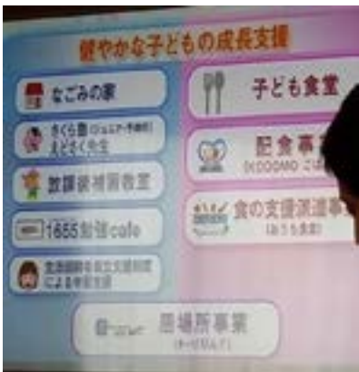
受け皿がしっかり伝わる仕組み

江戸川区と小山市ではこどもの貧困対策の視察を行いました。特に江戸川区では「実態把握のためにおこなったアンケートを整理、分析し、施策の拡充と再構築をおこなった点」は大いに学ばされました。それを担当したのが「経営