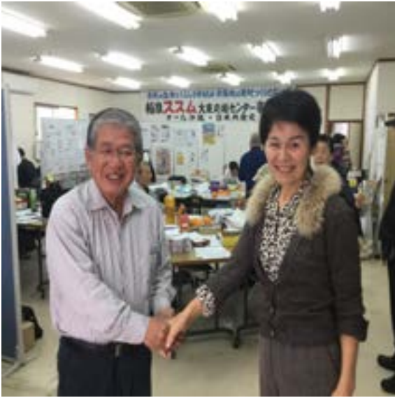
事務所で赤嶺政賢衆議院議員と

鈴鹿市議会議員（日本共産党） 発行 2018年 2月1日 265号 森川ヤスエの市政だより 鈴鹿市矢橋 3-10-34 電話：384-3740, fax:384-2907 URL: http://blog.ymorikawa.net/