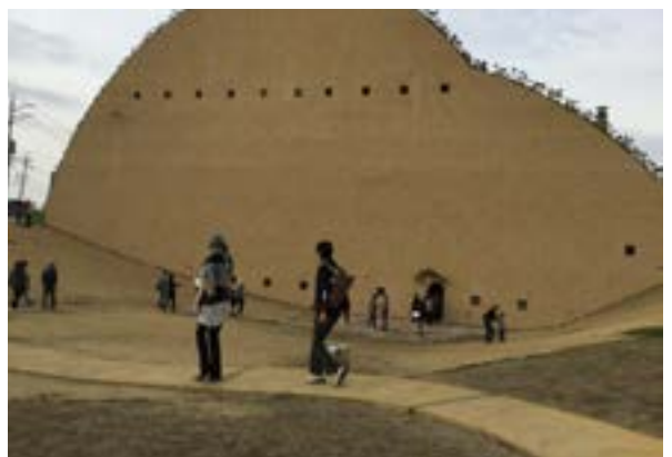
タイルミュージアム建物の全景